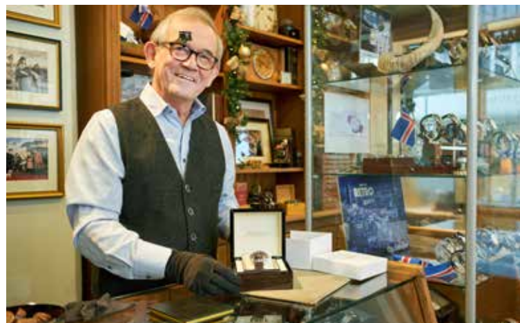
Gilbert úrsmíður tekur á móti viðskiptavinum með bros á vör alla daga.

Fólk er kynningarblað sem býður auglýsendum að kynna vörur og þjónustu í formi viðtala og umfjallana. Í blaðinu er einnig hefðbundnið ritstjórnarefni. Blaðið fylgir Fréttablaðinu daglega.