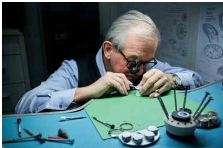
Fagmaðurinn er hér að störfum á verkstæði sínu.

Gilbert segir vönduð úr hafa margþætta þýðingu fyrir þá sem eignast eitt slíkt.