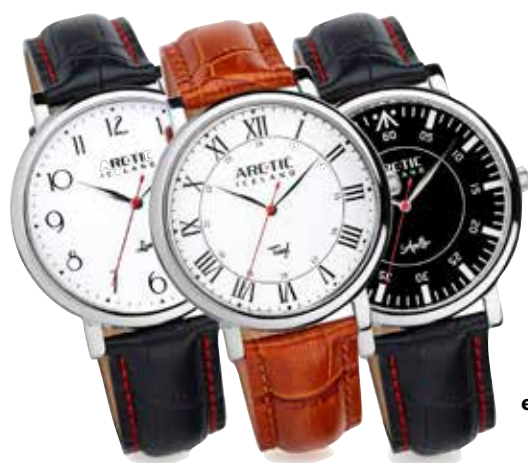
ARC-TIC úrin eru einstaklega falleg.