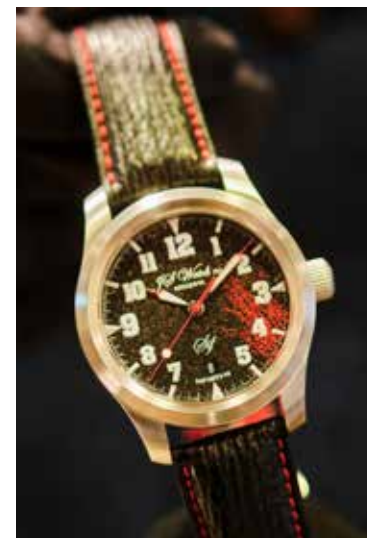
Vönduð úr eru tilvalin í jólapakkann og gleðja örugglega viðtakandann.