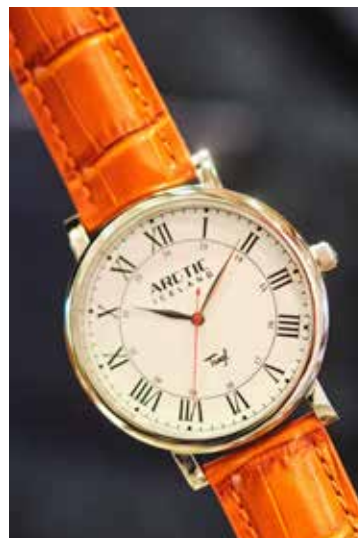
Í verslun Gilberts er að finna einstakt úrval af vönduðum úrum.

Gilbert úrsmíður er til húsa á Laugavegi 62, 101 Reykjavík. Opíð verður frá 10 á morgnana og fram á kvöld síðustu daga fyrir jól.